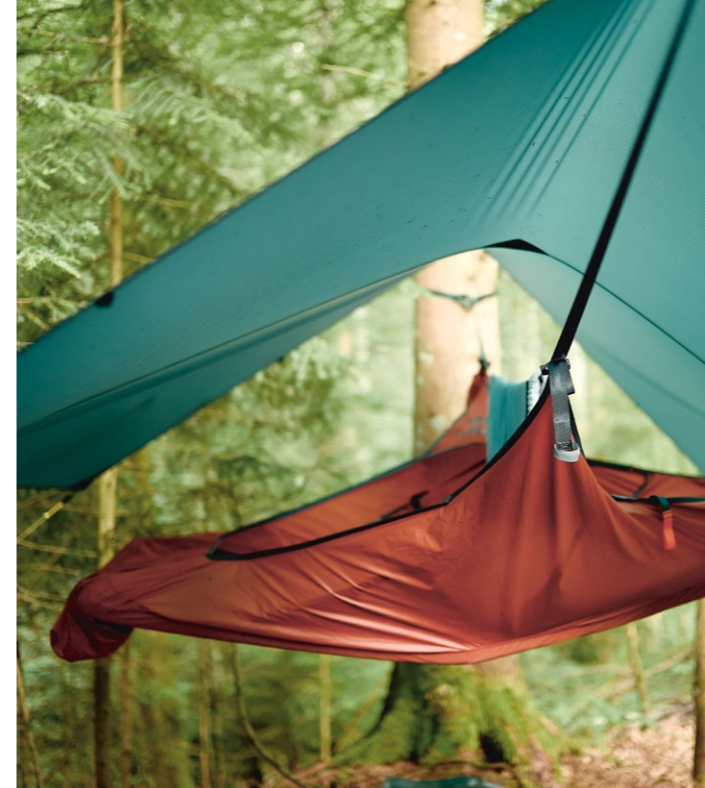
Bild links unten: Die Zeit im Wald ist Survival Training und spirituelles Erlebnis zugleich.

Bild links oben: Nur von einer Blache geschützt schläft Matthias Wenk in seiner Hängematte im Wald.